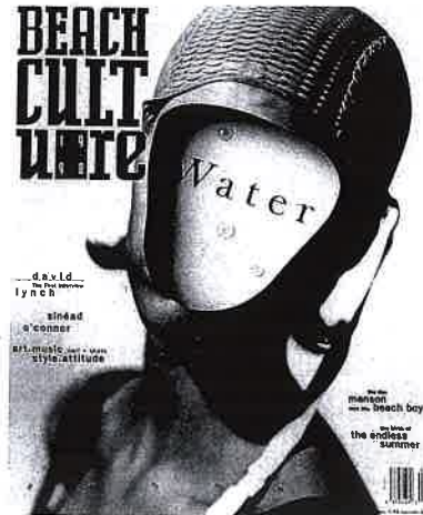
Carson 1990 Cover