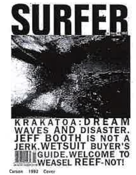
Carson 1992 Cover

1991-92: redesigns the over 30-year-old "Surfer" magazine. 1992-95: designs "Ray Gun" magazine. 1993: works as a graphic designer for Levi's, Nike, Pepsi Cola, American Express, CITIBANK, Coca-Cola, MCI, National Bank and Sega, and for the musicians David Byrne and Prince. Exhibition at the Neue Sammlung, Munich (1995). Numerous lectures. Carson's typographical work continues the formal experiments of the "Objets trouvés" movement. Carson has become a model frequently imitated in the 1990s.