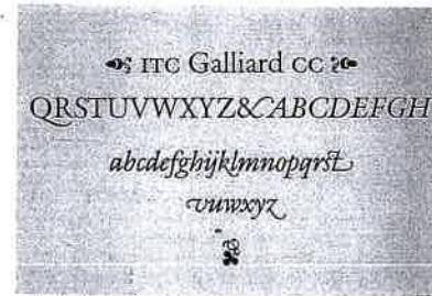
Matthew Carter 1978 Galliard