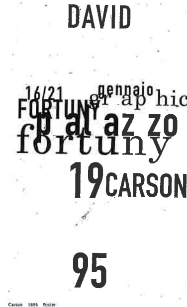
Carson 1985 Poster

des Computers für Layoutarbeiten. 1991-92 Neugestaltung der seit über 30 Jahren erscheinenden Zeitschrift „Surfer“. 1992-95 Gestaltung der Zeitschrift „Ray Gun“. 1993 als Grafik-Designer tätig für Levi's, Nike, Pepsi Cola, American Express, CITIBANK, Coca-Cola, MCI, National Bank, Sega und für die Musiker David Byrne und Prince. Ausstellung in der Neuen Sammlung, München (1995). Zahlreiche Vorträge. Carson's typographische Arbeit führt formale Experimente der „Objets trouvés“-Bewegung fort. Carson wird in