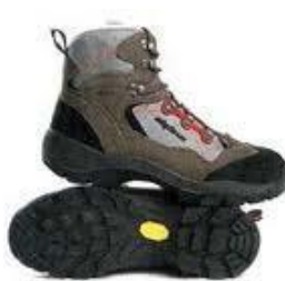
Nepremočljivi terenski čevlji z gumastim narebričenim podplatom