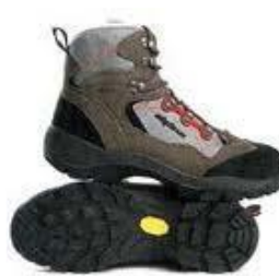
Nepremočljivi terenski čevlji z gumastim narebričenim podplatom ali delovni škornji izdelani v skladu s standardom EN 20347