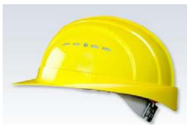
Varnostna čelada mora biti izdelana v skladu s standardom EN 397