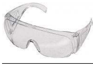
Varovalna očala mora biti izdelana v skladu s standardom EN 166