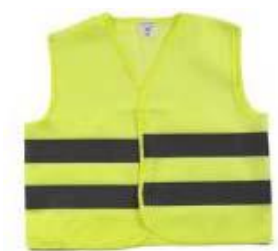
Odsevni jopič mora biti izdelan v skladu s standardom EN 471