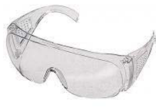
Varovalna očala mora biti izdelana v skladu s standardom EN 166