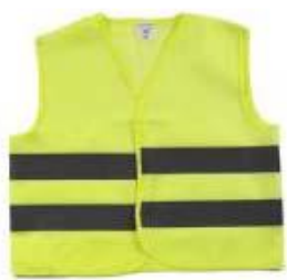
Odsevni jopič mora biti izdelan v skladu s standardom EN 471