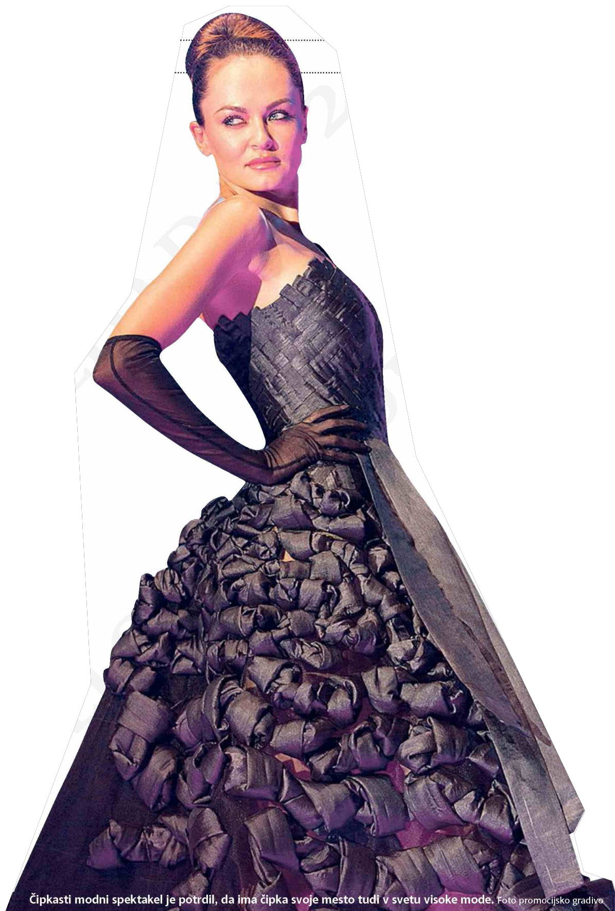
Čipkasti modni spektakel je potrdil, da ima čipka svoje mesto tudi v svetu visoke mode.