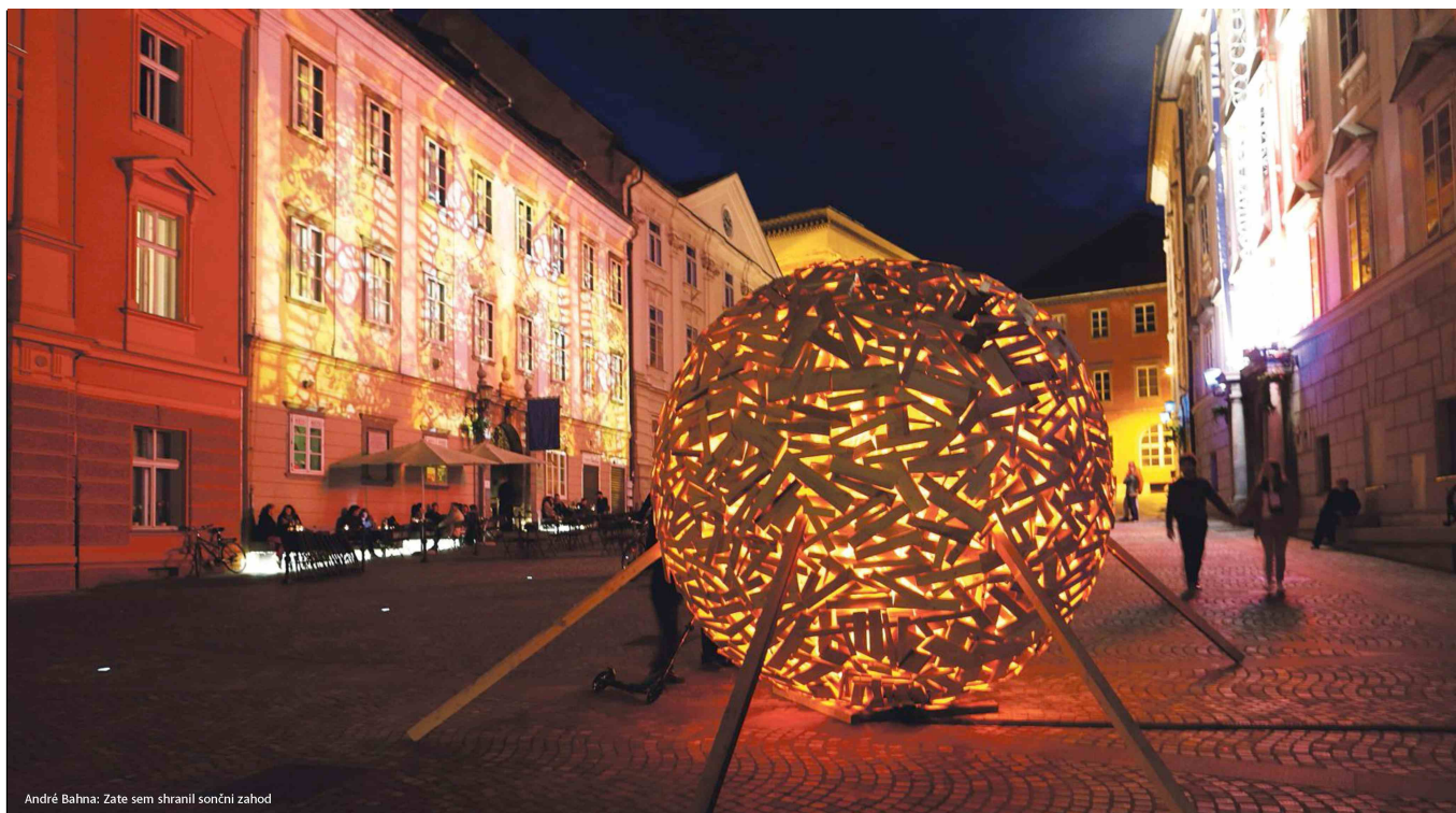
André Bahna: Zate sem shranil sončni zahod