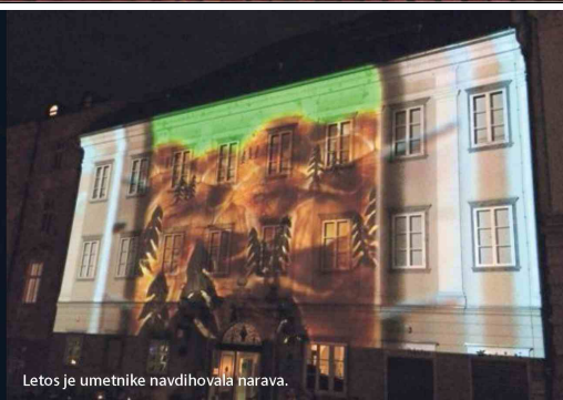
Letos je umetnike navdihovala narava.