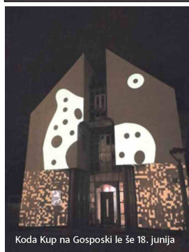
Koda Kup na Gosposki le še 18. junija