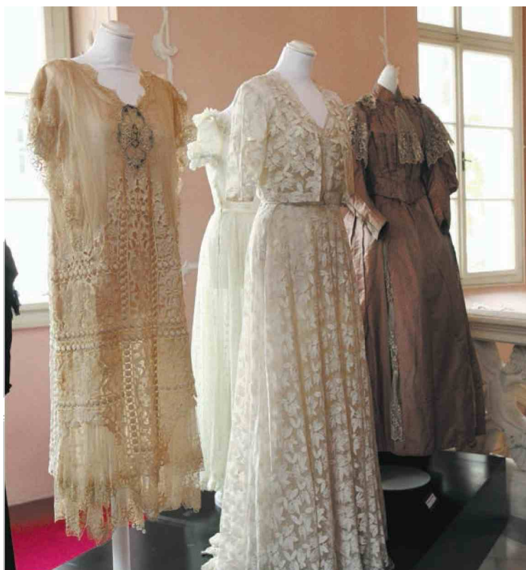
▲ Moda in umetnost v Pokrajinskem muzeju Maribor